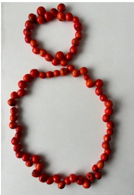
Obrázek 4 - hotové jeřabinové korále

Korále můžeš využít jako dárek pro maminku nebo kamarádku či si s nimi můžeš vyzdobit svůj pokoj.