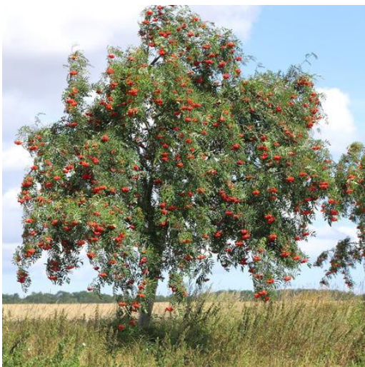
Obrázek 1 - jeřáb ptačí

Po navléknutí korále zavaž na uzlíky a máš hotovo. 😊