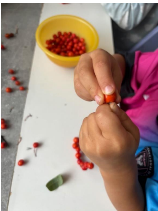
Obrázek 3 - navlékání jeřabin na nit