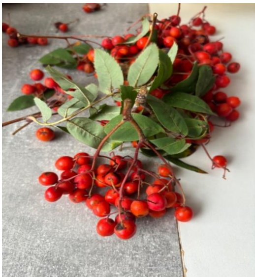
Obrázek 2 - nasbírané jeřabiny