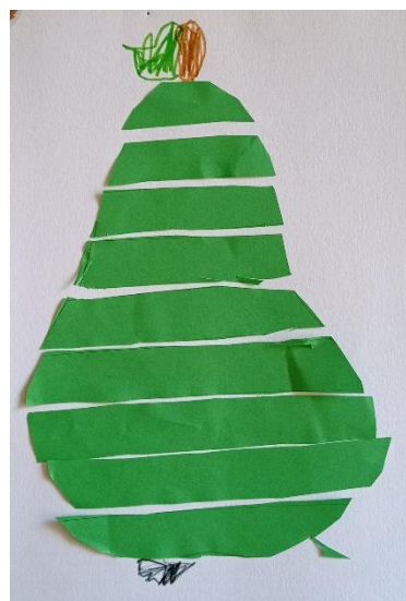
Starší děti (5 – 6 let)

Než ti obrázek pořádně zaschne, můžeš si procvičit své prstíky, jako bys chtěl vzít ovoce za stopku jen dvěma prsty.