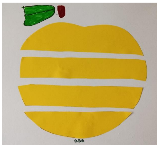
Mladší děti (4 roky)

Podívej se, jak by měl hotový obrázek vypadat: