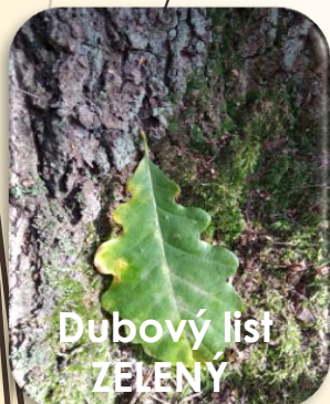
Dubový list ZELENÝ