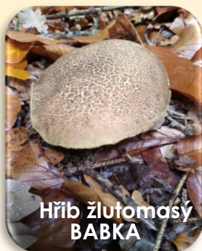
Hřib žlutomasý BABKA