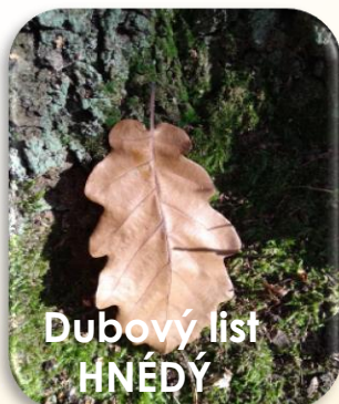
Dubový list HNĚDÝ