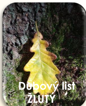
Dubový list ŽLUTÝ