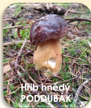
Hřib hnědý PODDUBÁK