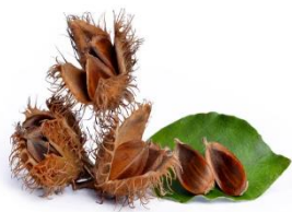
Buk lesní – plod bukvice