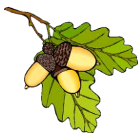
Dub letní – plod žalud