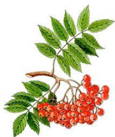
Jeřabina lékařská – plody jeřabiny