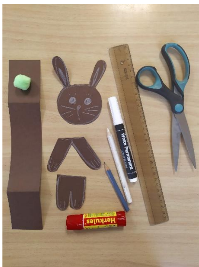
Obr. č. 1- pomůcky

Postup: Z delší strany čtvrtky A4 vystříhni proužek o šířce 5 cm. Přelož obě strany tak, aby se uprostřed setkaly (viz obrázek č. 2). Dále si z papíru vystříhni přední i zadní nožky a hlavičku s oušky (tvar můžeš vystříhnout podle své fantazie). Dokresli detaily jako je čumáček, uši a drápky. Vše slep lepidlem dohromady dle obrázku. Nakonec přilep ocásek. Hlavičku připevni na tělíčko přímo, nebo na oddělený a přeložený kousek čtvrtky, pak se hlavička bude hýbat – viz obr. č. 3.