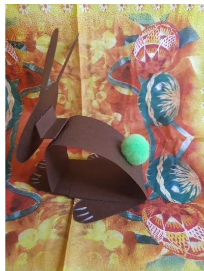
Obr. č. 3 – upevnění hlavy